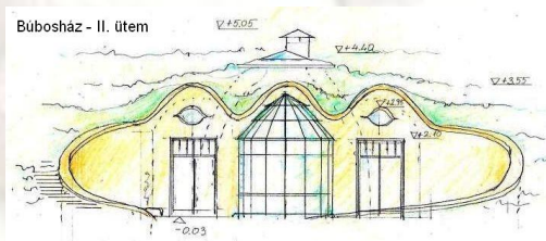
Búbosház - II. ütem